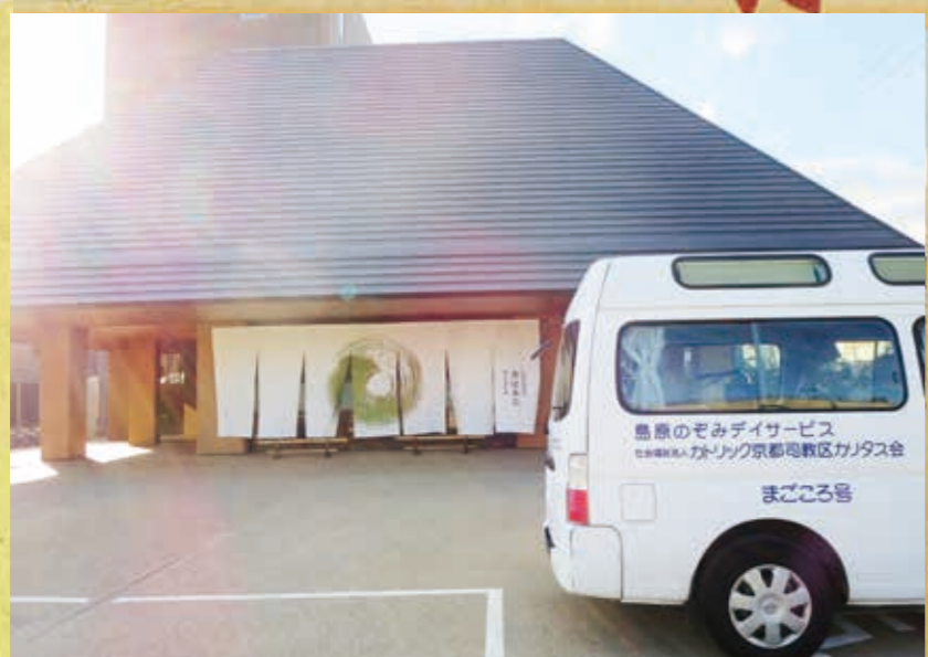
↑ お天気に恵まれました。