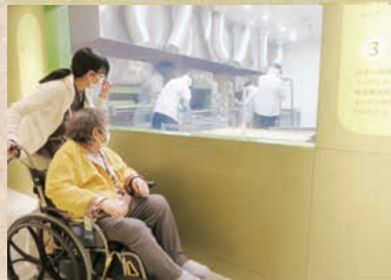
京ばあむマスターさんたちです