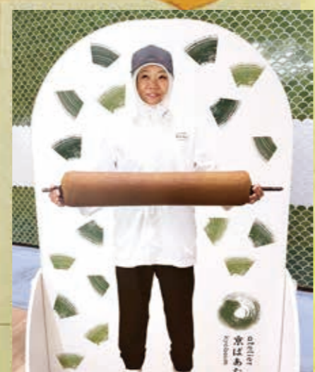
↑ 顔ほめパネルあり

工場見学は初めての 試みでした。 館内はとてきれいで バームクーヘンを焼いている いいにおいがしていました。 もちろんバリアフリーで 老若男女問わず楽しめるとうでした。