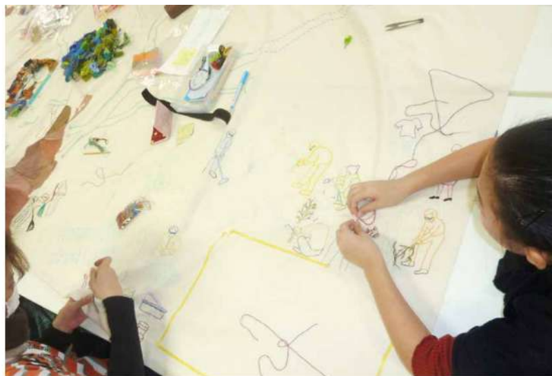
特集：東九条カルチャーシーン